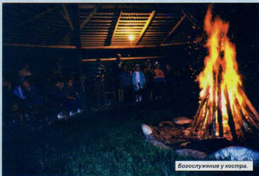
Богослужение у костра.