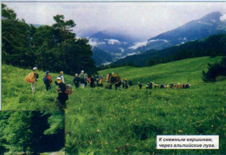
К снежным вершинам, через альпийские луга.

Молитвенная жизнь, изучение Слова Божьего, нравственное воспитание и утверждение в вере - основная цель пребывания в лагере.