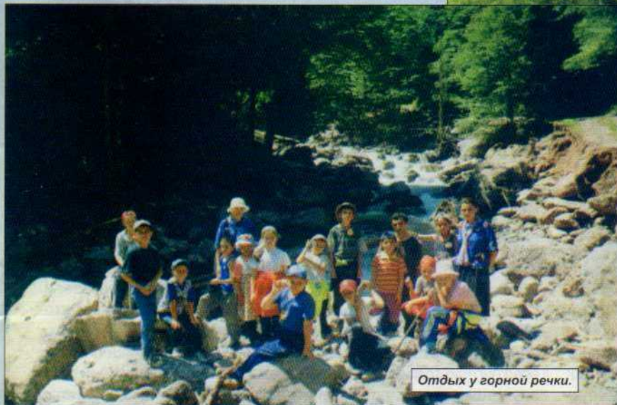
Отдых у горной реки.

В то же время дети ежедневно ходят в походы, которые так много значат для них. Ведь это не только физическая нагрузка, испытание выносливости, терпения, но главное - прославить Всемогущего Творца за красоту и величие творения, которые увидишь с высоты птичьего полета. Восторг красотой Божьего творения навсегда оставит в юном сердце трепетное благоговение перед Создателем. Да, именно восторг и благоговение вызывают потоки радостных слез, когда подростки встают на колени на благоухающей цветами поляне и возносят хвалу Богу. Хвалу за радость, хвалу за счастье, хвалу за спасение!