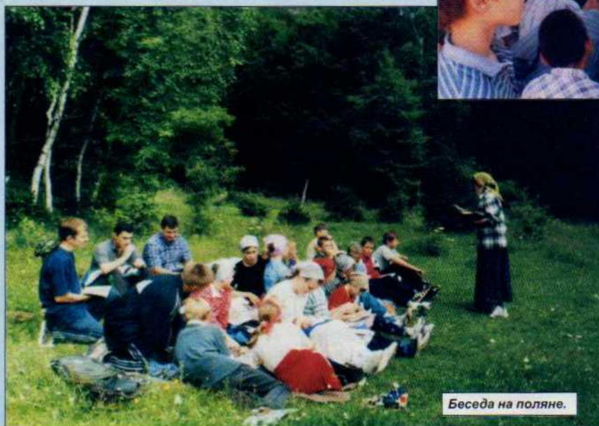
Беседа на поляне.

кой созданы все условия для приятного отдыха: два деревянных спальных корпуса (для мальчиков и девочек), вместительная столовая, две бани с сауной, большой бассейн, оборудована площадка для спортивных игр и, конечно, место для проведения богослужений, и даже специально подготовлено место для вечернего костра.