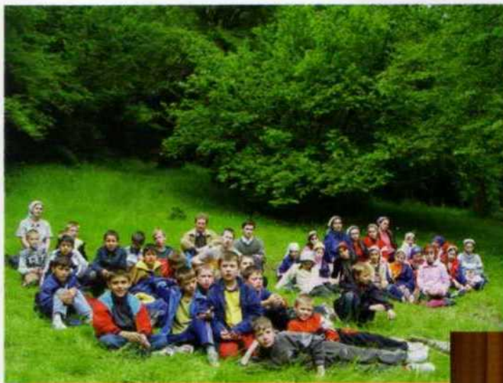
Дети любят активный отдых на природе.

после предварительной подготовки на ежегодных курсах учителей воскресных школ. Не все учителя воскресной школы имеют специальное педагогическое образование. Когда Бог избирает и призывает на это служение, главное состоит не в наличии диплома, а в любви к Господу и Его Слову, в любви к детям и в желании учиться, независимо от возраста. Помазание Святого Духа действует в освященном сердце. Молитва Церкви укрепляет учителя – в его труде.