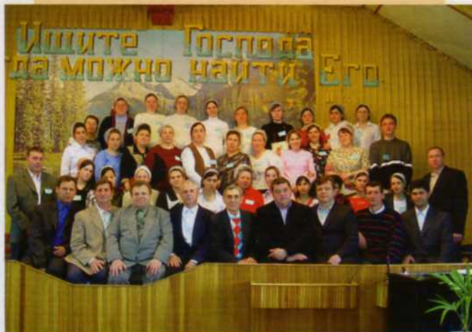
Участники конференции учителей воскресных школ со старшими служителями Северо-Кавказского региона. Краснодар, 2006.

пробуждают в них благоговение к Творцу и Спасителю, жажду служения Господу, учат молиться, поклоняться и славить Бога.