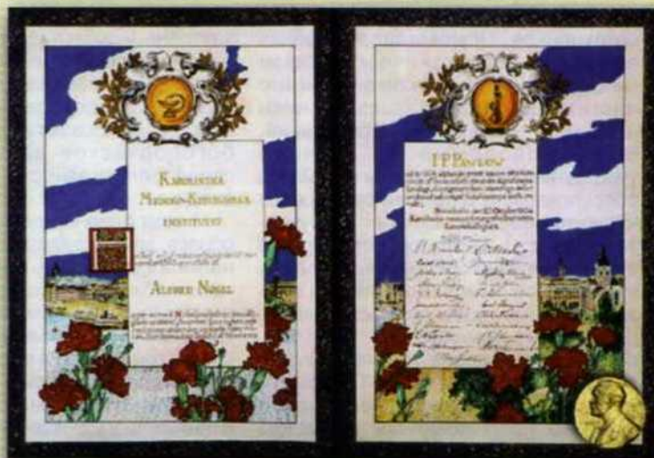
Диплом и золотая медаль лауреата Нобелевской премии, 1904 год.

Павлов был простым, честным, бесхитрым и даже застенчивым человеком. Зависть к его таланту выплескивалась в интригах. Некоторые видные физиологи относились к нему недружелюбно, потому что он, будучи еще молодым ученым, осмеливался иногда вступать с ними в острую научную дискуссию и выходил победителем. Он нуждался в средствах не только для семьи, но и для развития отечественной и мировой науки, однако ему отказывали в финансировании. Его приглашали работать в Варшавский университет, но в России даже не дали кафедру физиологии в Томске. Иван Петрович не переехал в Варшаву. Важным событием в его жизни явилось начало работы в учрежденном незадолго до этого Институте экспериментальной медицины. В 1891 году меценат этого института принц Ольденбургский пригласил его руководить отделом физиологии, что Павлов и осуществлял до конца своей жизни (т.е. 44 года!). Именно здесь были выполнены классические работы ученого по физиологии главных пищеварительных желез, принесшие ему мировую славу и отмеченные в 1904 году Нобелевской премией. Кстати, это была первая Нобелевская премия, присужденная за исследования в области медицины. Павлов доказал, что деятельность