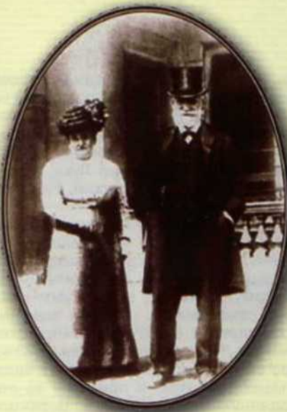
Фото с женой

этом позже академик Павлов написал статью «Об уме вообще, о русском уме в частности» (журнал «Природа», № 8, 1999 г.). Очень интересно сопоставить эту статью с 7-ой, 8-ой и другими главами книги Феофана Затворника «Невидимая брань», где говорится о дисциплине чувств, ума, помыслов, а также об обуздании страстей.