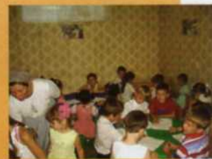
Уроки в разных возрастных группах.