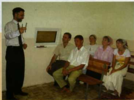
Перед началом занятий беседу с учителями ВШ проводит служитель церкви. Станица Елизаветинская, 2006.

В нашей поместной церкви, входящей в состав Объединенной Церкви Христиан Веры Евангельской, воскресная школа действует с 1990 года. Дети обучаются и воспитываются на основании Слова Божьего. Учителя